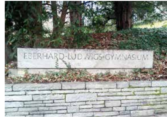
Das Eberhard-Ludwigs-Gymnasium am Herdweg wurde 1954 auf dem Gelände der ehemaligen Villa des Grafen von Zeppelin errichtet. Für das denkmalgeschützte Gebäude erhielt Architekt Hans Bregler 1959 den Paul-Bonatz-Preis.